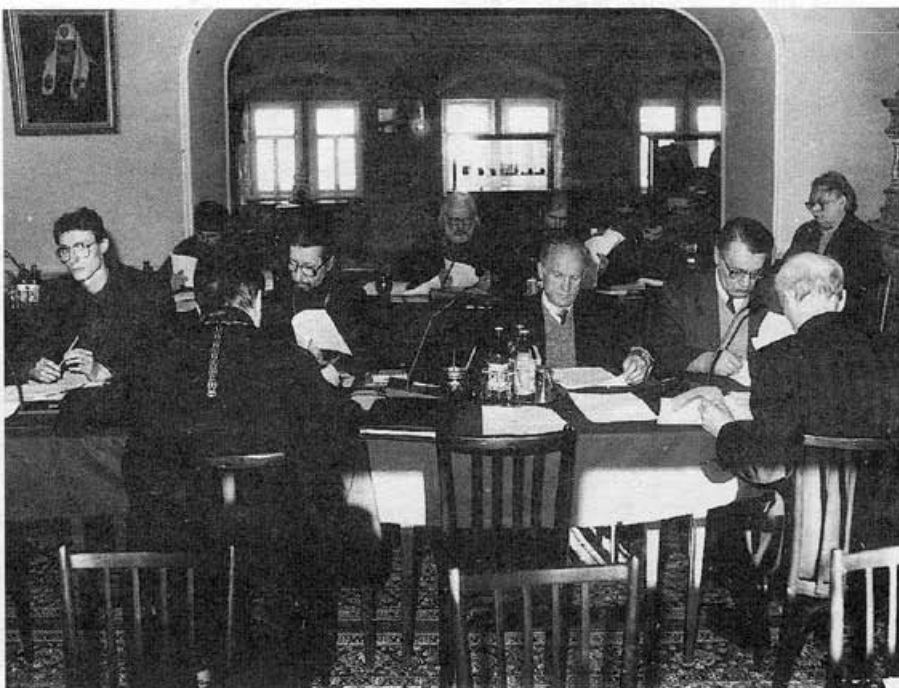
Богословская комиссия. Малый актовый зал МДА