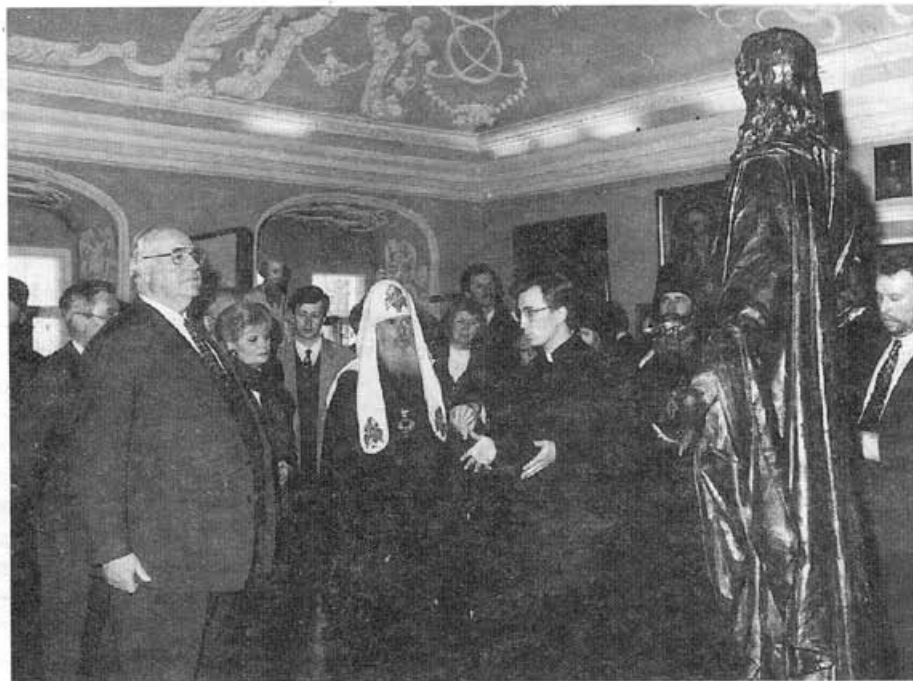
Канцлер Г. Коль и Патриарх Московский и Всея Руси Алексий II в музее МДА

споров. В частности, об участии Православных Церквей в экуменическом движении говорилось как о голосе Православия в ВСЦ, что оно имеет и положительное значение, хотя это, главным образом, касается свидетельства об истине. И все же вместе с Пророком хочется сказать: Господи, кто поверил слышанному от нас, и кому открылась мышца Господня?