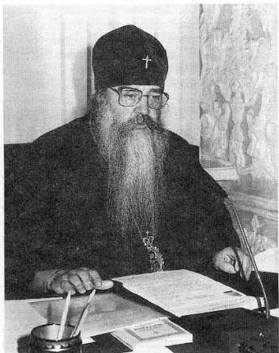
Митрополит Минский и Слуцкий Филарет